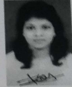
Photo & Specimen Signature of Candidate